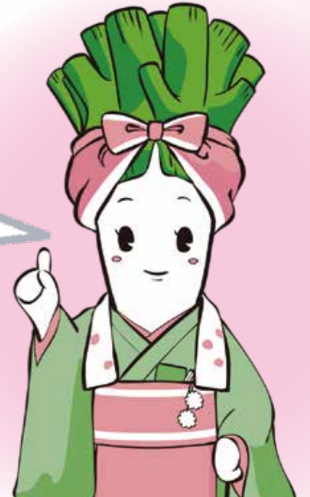
能代市ねぎ課マスコットキャラクター「白神ねぎのん」

生活習慣病の発症や重症化を防止するため、国民健康保険に加入している能代市の40歳以上の人を対象に 特定健診を無料 で実施しています。 特定健診 で年1回の健康チェックをしませんか？(治療中の方も対象です)