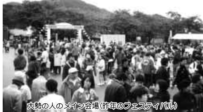
大勢の人のメイン会場(昨年のフェスティバル)