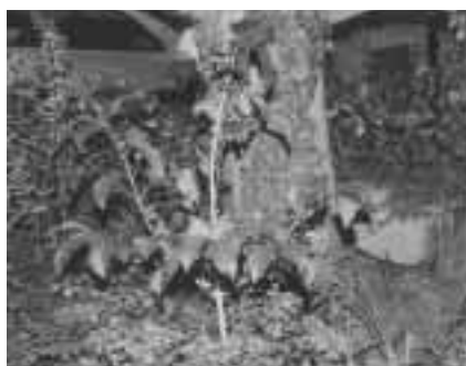
町内各所に自生する真弓の木

のかを調べることから始まり、 このカンジキが真弓の木からで きていることがわかりました。 町内でも自生している木です。 真弓の木は皮を剥くと白くとて もすべすべした木でした。早速 カンジキを作り納品しましたが、 残念なことに商売にはなりませ んでした。カンジキはだめでし たが、この木の素晴らしさを感じ ながら作ってみようと思い始め ました。