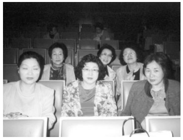
横浜市の音楽会で (前列中央)