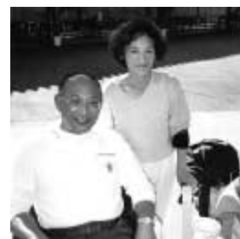
職場の親睦会で工場長とツーショット