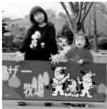
家族でマザー牧場に行った時のスナップ