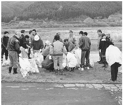
二ツ井地区の堤防

四月十四日、二ツ井町川と道の愛護会主催の二ツ井町ふるさとクリーンアップ大作戦が行われました。早朝から約千五百人もの町民が総出でゴミを拾い、いたるところにゴミがいっぱいに入った袋の山ができました。