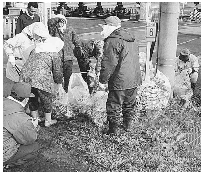
国道七号線沿い(大林)