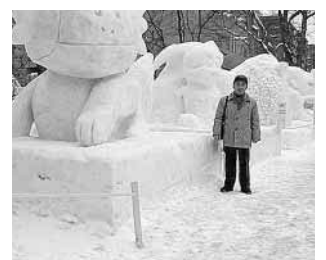
札幌雪まつりでのスナップ

故郷を離れて43年、この地に所帯をもって36年。月日の早さに自分自身戸惑いを感じております。両親もすでに他界、家もなし、されど故郷を忘れることができません。故郷を離れた方々皆同じ思いでしょう。近頃やたらと田舎の夢をみるようになった。風景、情景、そして友と、ボケのはじまりか？ 3年前、60の手習いとパソコンに挑戦、幸い先生(同居の娘夫婦)に恵まれ、数多くの叱咤激励をくりかえし、山坂の多い道を辿り、悪戦苦闘する事4カ月、ワード・エクセル・メール・インターネット・デジカメと、一応マスターした。苦勞した甲斐もあつて、いまではパソコンと遊ぶのも楽しみみな日々です。メル友の彼女(2年生の孫娘)もでき、算数や国語の問題をメールでやりとりして、練習にちょうど良い友です。また、独特な二ツ井井を保存しようと猛勉強中で、思い出すのに四苦八苦しっております(ずっぱりあるども 俺もはんかくしえもんで ながなが思いたしえねったでば...) 自治会で「方言の研究会」なるものを作つて、公民館で披露しようと意気込んでいるわけです。おりにつけ二ツ井町のホームページを開いて見るのも楽しみの一つ、新着情報、観光情報、総合案内、気象情報、リンク集、一通り目を通しては自己満足。そして、広報ふたついを改めて読みます。私の住む浦和もこの4月1日から政令都市になり(全国で14番目とか)、住所表示も変わります。新たな歴史の始まる年です。自治会の仕事をしている私にとっては、記念すべき思い出の年になります。二ツ井町も、能代山本地区の合併の話... 将来はどうなるのでしょうか？ 故郷はまだまだ厳しい寒さが続く事と思えます。くれぐれもご自愛ください。