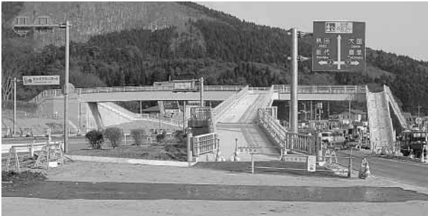
完成間近のきみまち歩道橋