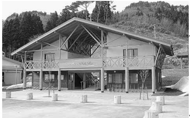
道の駅のパークりんりん（182台収容可能）