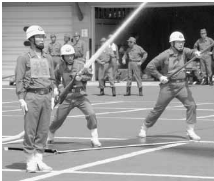
昨年の消防訓練大会

この大会は各消防団分団が「小型ポンプ操法」、「ポンプ車操法」、「規律訓練」などの消防技術を競うものです。ぜひ、会場にお越しいただき、消防団員にご声援をお願いいたします。なお、会場付近は関係車両で混雑しますので、役場向かい、100円ショップの駐車場右側奥に駐車をお願いいたします。