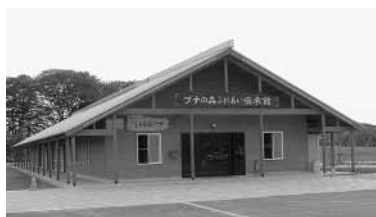
フナの森ふれあい伝承館

町では田園空間整備事業により整備された施設と既存の展示物等による田園空間博物館を恒久的に運営していくための取り組みを行い、地区内の活性化を図るための運営協議会会員を募集いたします。