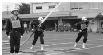
昨年の消防訓練大会

平成17年度二ツ井町消防訓練大会が、7月3日に役場駐車場前で午前9時から行われます。この大会は各消防団分団が「小型ポンプ操法」、「ポンプ車操法」、「規律訓練」などの消防技術を競うものです。ぜひ、会場にお越しいただき、消防団員にご声援をお願いいたします。なお、会場付近は関係車両で混雑しますので、役場向かい、100円シヨップの駐車場右側奥に駐車をお願いいたします。