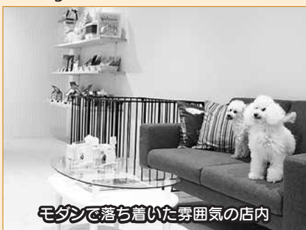
モダンで落ち着いた雰囲気の内

DOG.CRAFT (ニツ井町字三千蒨41-1) TEL:57-4226 Mail:dogcraft@outlook.jp f @dog.craft56