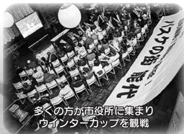
多くの方が市役所に集まりウィンターカップを観戦

今後も各大会でグッズを活用していただき、少しでも選手の皆さんの励みになってもらえたら嬉しく思います。