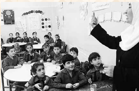
ヨルダンの公立小学校の朝の会の様子