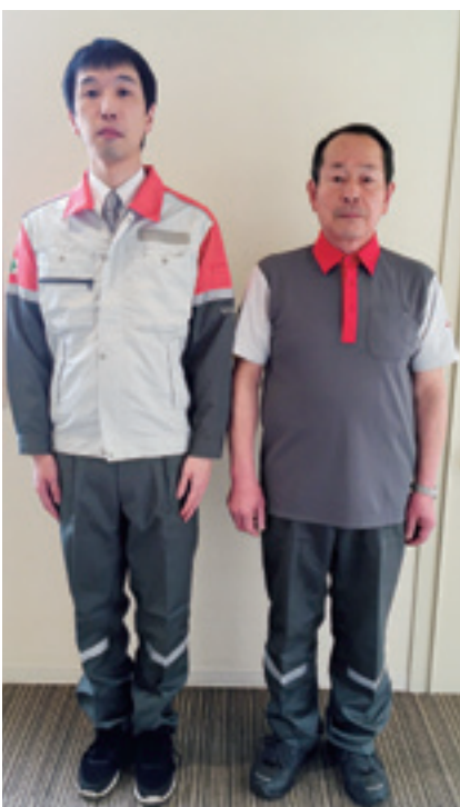
▲社員・検針員の新しい制服