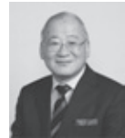
学長 北野 大

アルバイトで学費を払いながら 保育者を目指す夜間(第二部)の 学生が増えています。