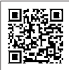
マイナポイントについて