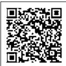
マイナンバーカードの申請について

マイナンバーカードの申請や受け取り、電子証明書の各種手続き 必要なもの 本人確認書類など ※詳細はお問い合わせください。 ※申請に必要な顔写真の撮影を無料で行っています。