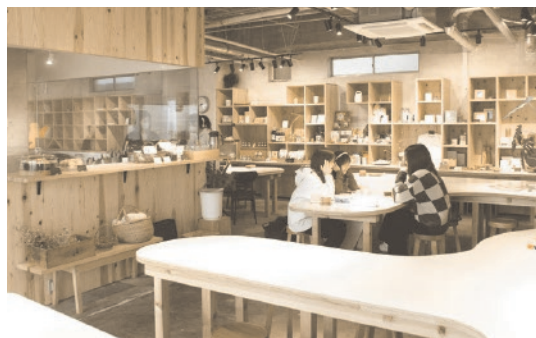
▲マルヒコビルディング 1階カフェスペース

〈香蓮〉協力隊になってもう すぐ2年半です。イベントの 連続で、あつという間に過ぎ るなっていうのが実感です ね。最近、二ツ井の梅内に引 越したんですけど、能代って 面白いですね。能代と二ツ井 の雰囲気全然違うんです よ。能代のまちなかは、便利 で楽しいし、自然豊かな二ツ 井もすごく好きで、それぞれ 良いですね。どちらも知った からこそ見えることもあるな と最近思っています。情報発 信に関しては、情報量とス ピード感が大事だと思ってい て、夏場はSNSを毎日更新 していましたね。