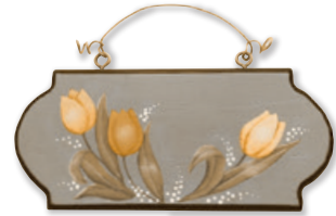
トールペイント講座