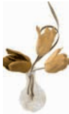
季節の花「チューリップ」を作ります。