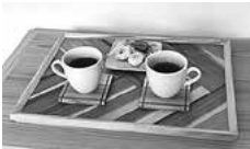
カフェトレとコースターのセット