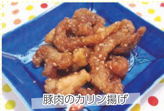
豚肉のカリン揚げ