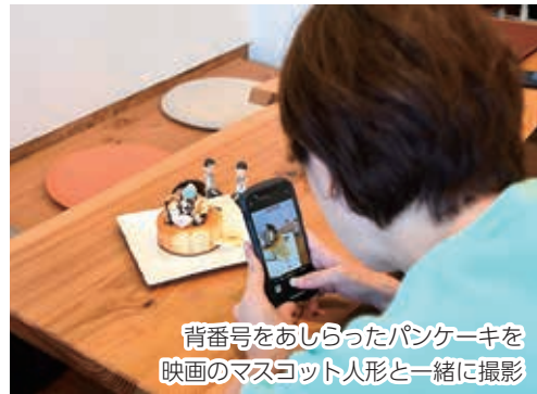
背番号をあしらったパンケーキを 映画のマスコット人形と一緒に撮影

ほぼ毎日X（旧ツイッター）で情報発信。さまざまな話題が毎回注目され、フォロワーは間もなく1万人！担当の「中の人」は「多い日は1日3～4件アップ。情報が偏らないように気を付けて、能代科学技術高校や秋田ノーザンハピネッツ、JRペッカーズ、アランマーレ秋田などの話題を発信しています」と教えてくれました。