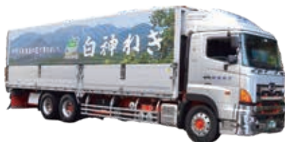
ラッピングトラック

ポスターやのぼり、はんでんを作成しトップセールスの際などに活用しています。また「動く広告塔」としてラッピングトラックを用意。関東方面へ出荷する場合に活躍しています。