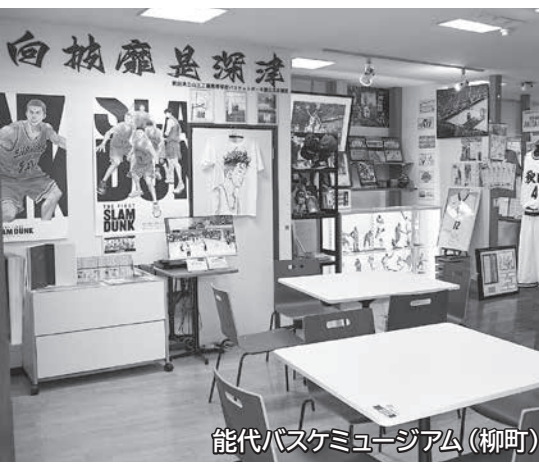
能代バスケミュージアム(柳町)

人気漫画「スラムダンク」が原作の映画「THE FIRST SLAM DUNK」が大ヒット興行となったことから、作品に登場する強豪校のモデルと言われている