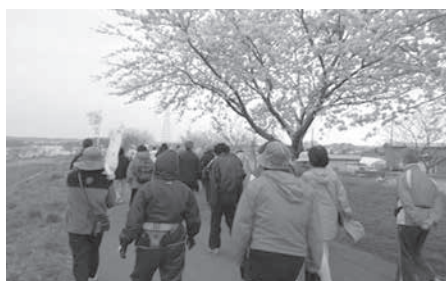
1, 2, 1, 2ウォーキング

健 康推進員研修会に参加しました。「さて、血圧のお薬は続けて飲むべきか、否か」と問題形式で始まった先生のお話、健康維持のためにお薬は続けるべき、笑う人は長生きなどの楽しいお話に引き込まれて、あっという間の2時間でした。身近な質問にも一つひとつ答えてくださり、「医者いらずの健康長寿法」と題した講話は素晴らしかったです。