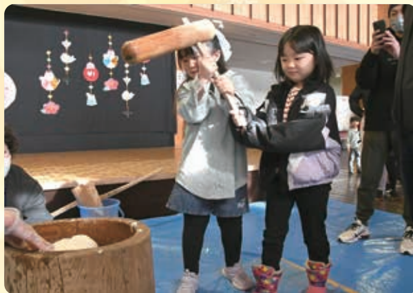
↑ヨイショ！の掛け声に合わせて餅つき

能代ふれあいプラザサンピノで、新年のつどいが4年ぶりに行われました。あやとり、けん玉、おはじきなどの昔の遊びコーナーのほか、能代第一中学校吹奏楽部による新年祝賀ステージや餅つき体験、甘酒の提供などが行われ、会場は多くの家族連れでにぎわいました。