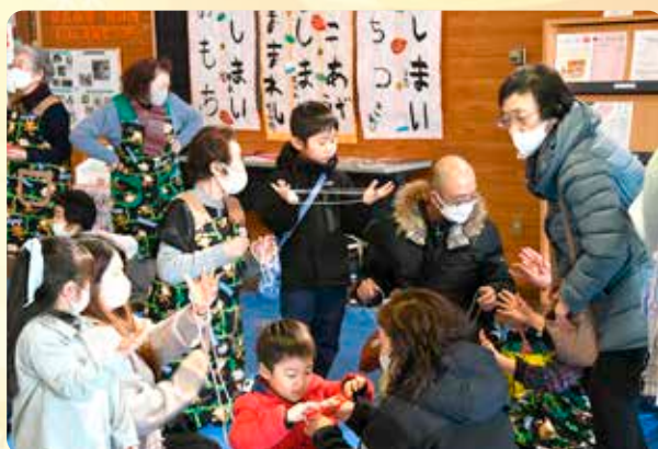
↑世代問わずあやとりやけん玉などの昔の遊びを体験