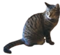
看板猫のちゅうらん