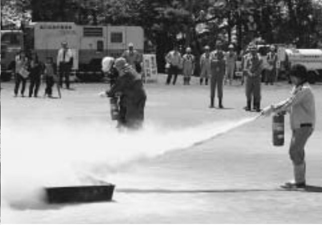
(防災訓練でのバケツリレーや消火活動の様子) お互い協力し合いながら、防災活動に組織的に取り組むことができるよう頑張っています！