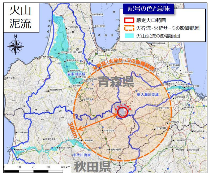
(「十和田火山災害想定影響範囲図」より抜粋)