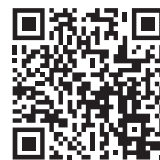
こども家庭庁 ホームページ

A. 子育て支援は、こどもたちが健やかに成長していくためのものであり、そのこどもたちは将来の社会保障の担い手になるため、独身者や高齢者も含む全ての世代や企業の皆さまから拠出することとなっています。