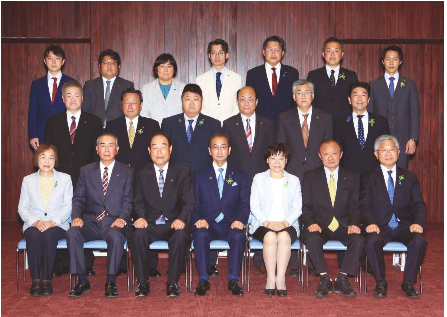
改選後、初の定例会(議場にて)