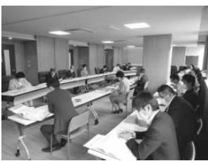
文教民生委員会の様子