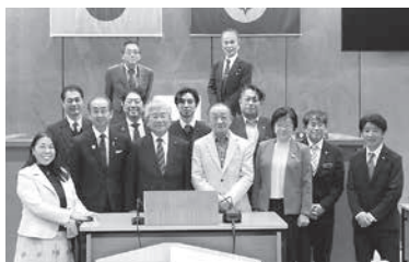
角田市議会議員の皆さんと