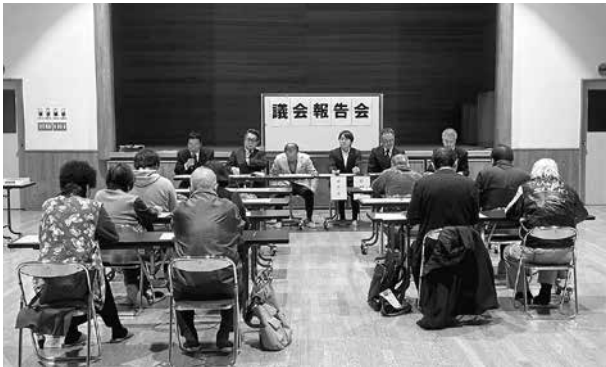
議会報告会の様子