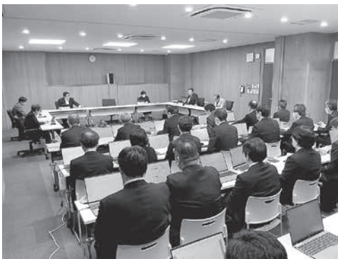
総務企画委員会の様子

答 県内の市の大半が県と同様に引き上げると聞いている。本市においては、県の特別職と比較して支給割合が低い状況にあり、県に準じる形で引き上げようとするものである。