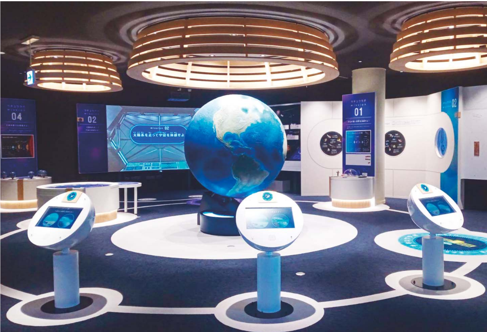
生まれ変わった子ども館の展示室