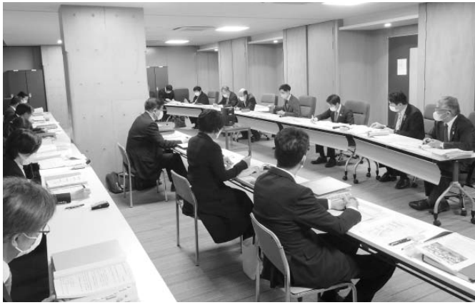
文教民生委員会の様子