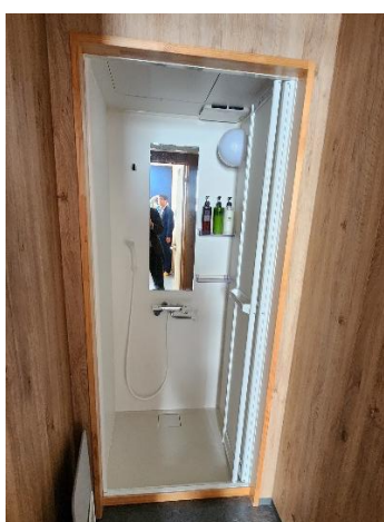
シャワールーム完備。