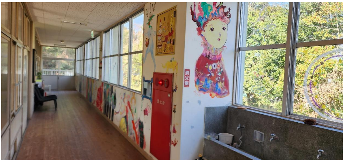
校舎内にはアート作家による絵が書かれていて、来場者の目を引く工夫が感じられる。