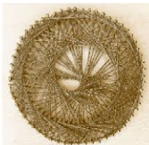
糸かけ曼茶羅「らせん」