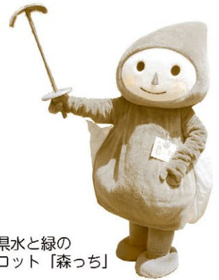
秋田県水と緑の マスコット「森っちゃん」

地球温暖化をはじめとする環境問題の解決には、一人ひとりが自らの生活・行動を見直すことが大切です。国では、環境保全について国民や事業者の理解と積極的な取り組みを進めるため、毎年6月を「環境月間」として定めています。この機会に身近な環境について目を向けてみませんか。