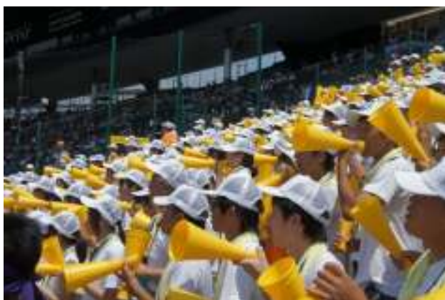
「全校野球」甲子園アルプススタンドでの応援