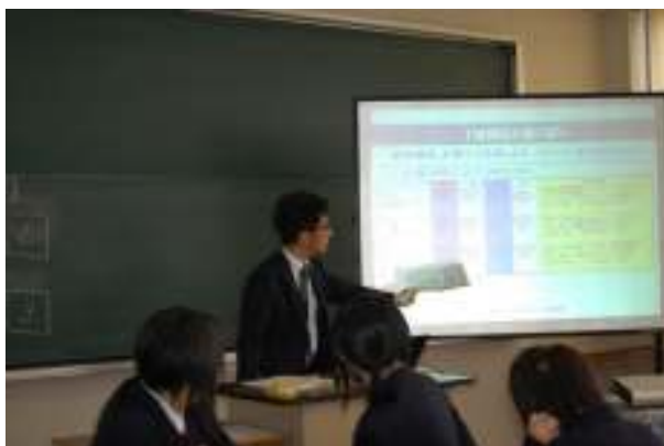
ライフプラン講座