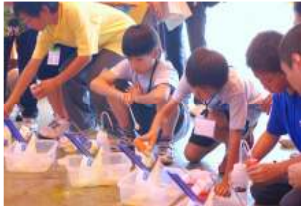
10月 相模原市の子ども会議での見学