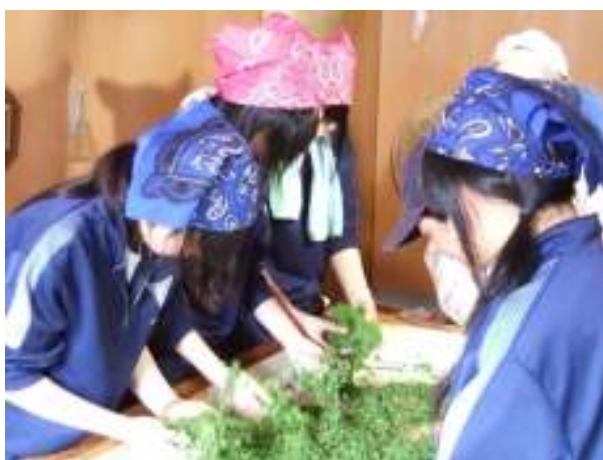
あきんど「檜山茶手もみ作業」