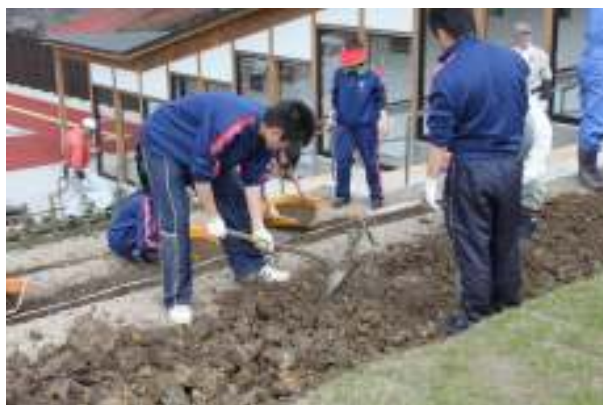
あきんど「檜山茶の苗植え作業」