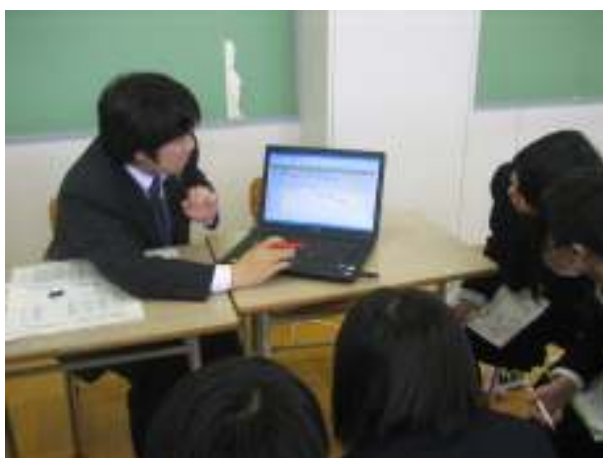
ライフプラン講座