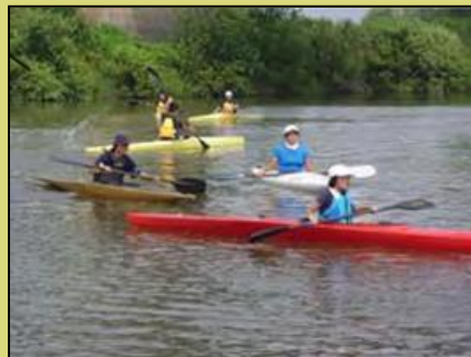
カヌー体験（山形県河北町最上川）