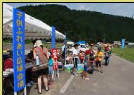
イベント（山形県庄内町最上川）