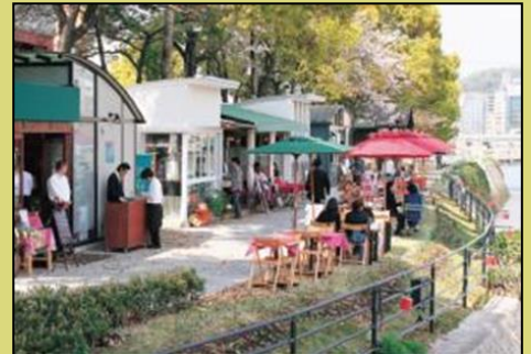
オープンカフェ（広島市京橋川）