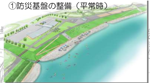
①防災基盤の整備（平常時）