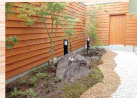
浴室から楽しめる庭