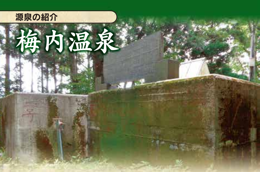
梅内集落の裏山にある冷泉タンク。 右が集落用タンク、左がゆっちゃん・ふっちゃん用タンク。 集落用タンクの上には温泉組合設立十周年記念碑がある。