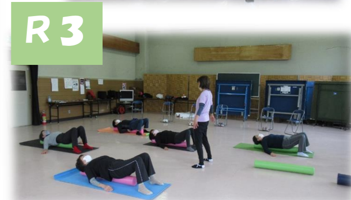
～ストレッチポールで エクササイズ～