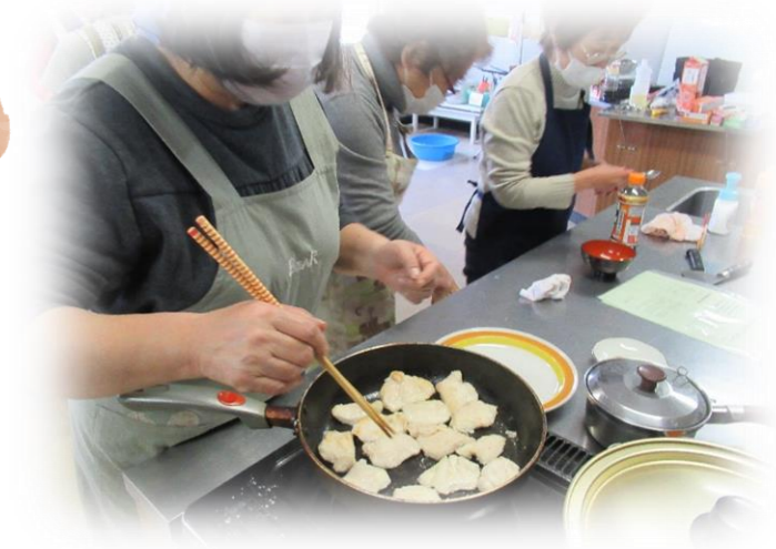
R5年度は「冬に負けない筋力アップメニュー」を作りました！