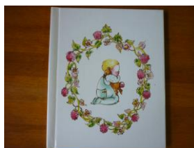
⑥ベビー・メモリアルBOX