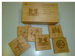
②秋田杉のメモリーカード