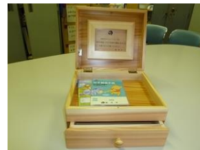
③メモリアルボックス