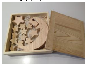
④ゆらゆらお月さまと星の積み木