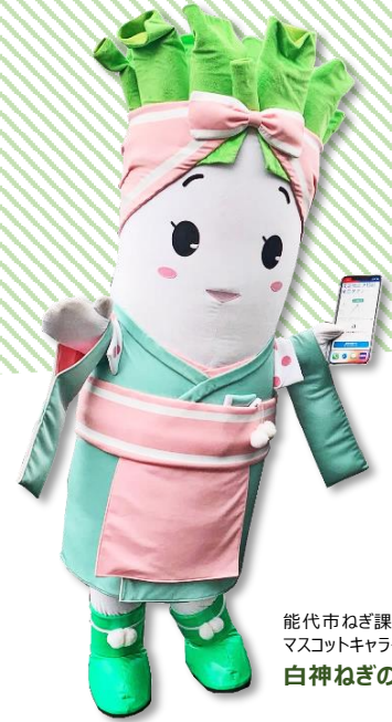
能代市ねぎ課 マスコットキャラクター 白神ねぎのん