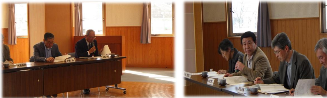
第1回地域協議会の様子

発行：二ツ井地域局 総務企画課 〒018-3192 能代市二ツ井町字 上台1-1 電話 0185-73-2112