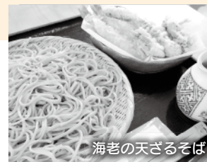
海老の天ざるそば