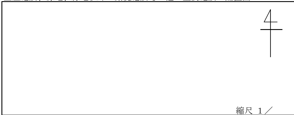
生産施設、緑地、緑地以外の環境施設その他の主要施設の配置図