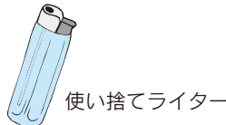
使い捨てライター