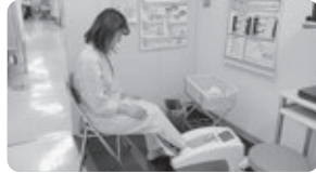
測定器に素足を入れます。